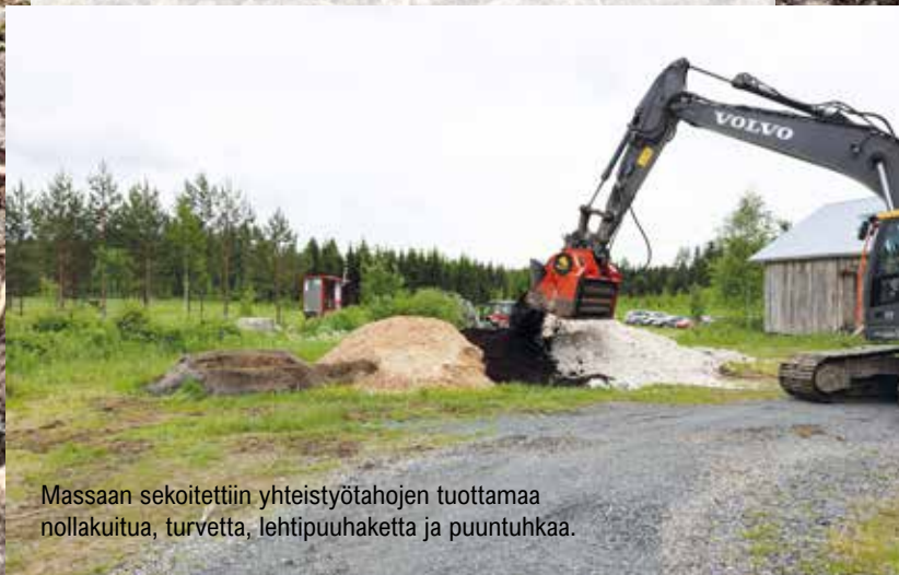
Massaan sekoitettiin yhteistyötahojen tuottamaa nollakuitua, turvetta, lehtipuuahaketta ja puuntuhkaa.