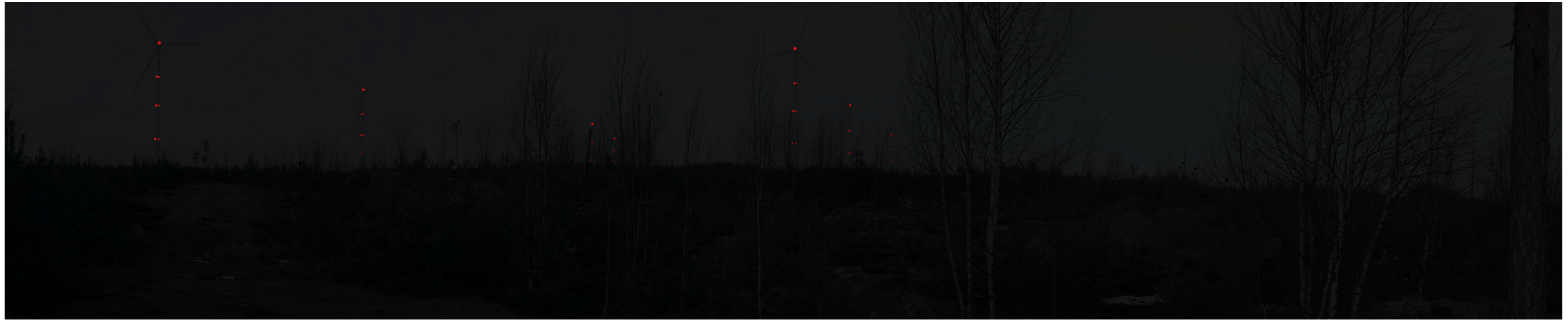
Pimeän ajan havainnekuva Leppijärvenkeitaaltapäin kuvattuna.