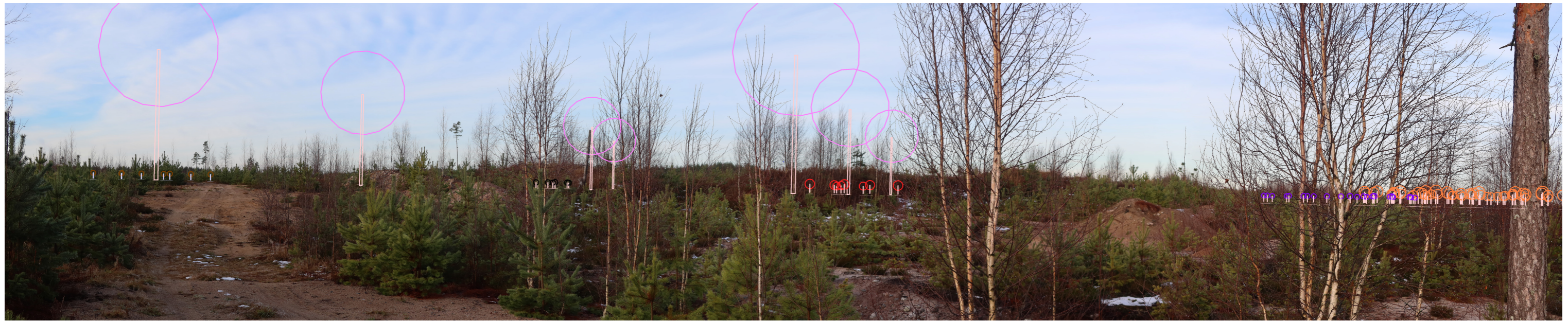
Symbolikuva yhteisvaikutuksista pinkillä Santakangas, ruskealla Jäneskeidas, mustalla Korvenevea, punaisella Kultakalliot, violetilla Surmankeidas ja oranssilla Kolmihaara.