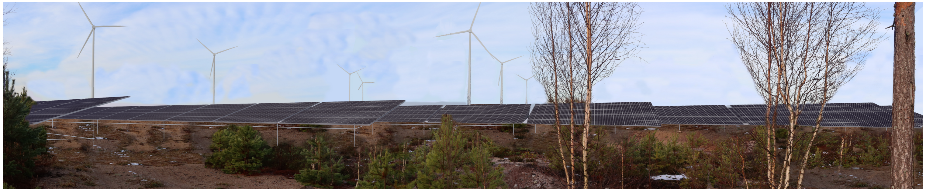
Havainnekuva, etäisyys tuulivoimaloista 1 km ja aurinkovoimaloista noin 30 metriä.