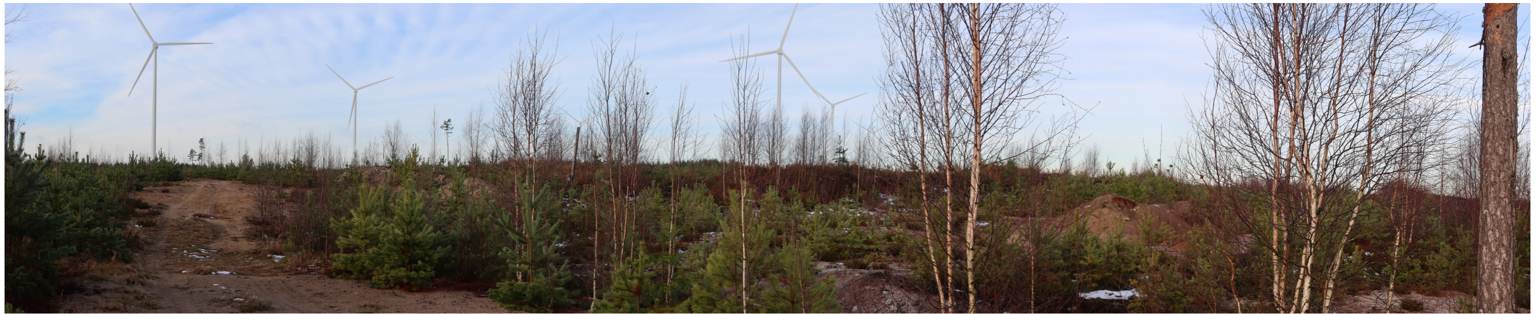
Havainnekuva voimaloiden yhteisvaikutuksista