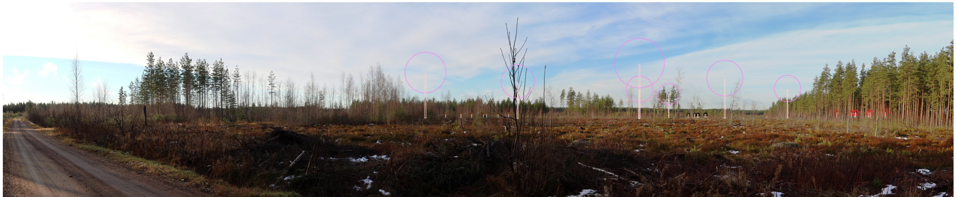
Symbolikuva yhteisvaikutuksista pinkillä Santakangas, ruskealla Jäneskeidas, mustalla Korvenneva ja punaisella Kultakalliot