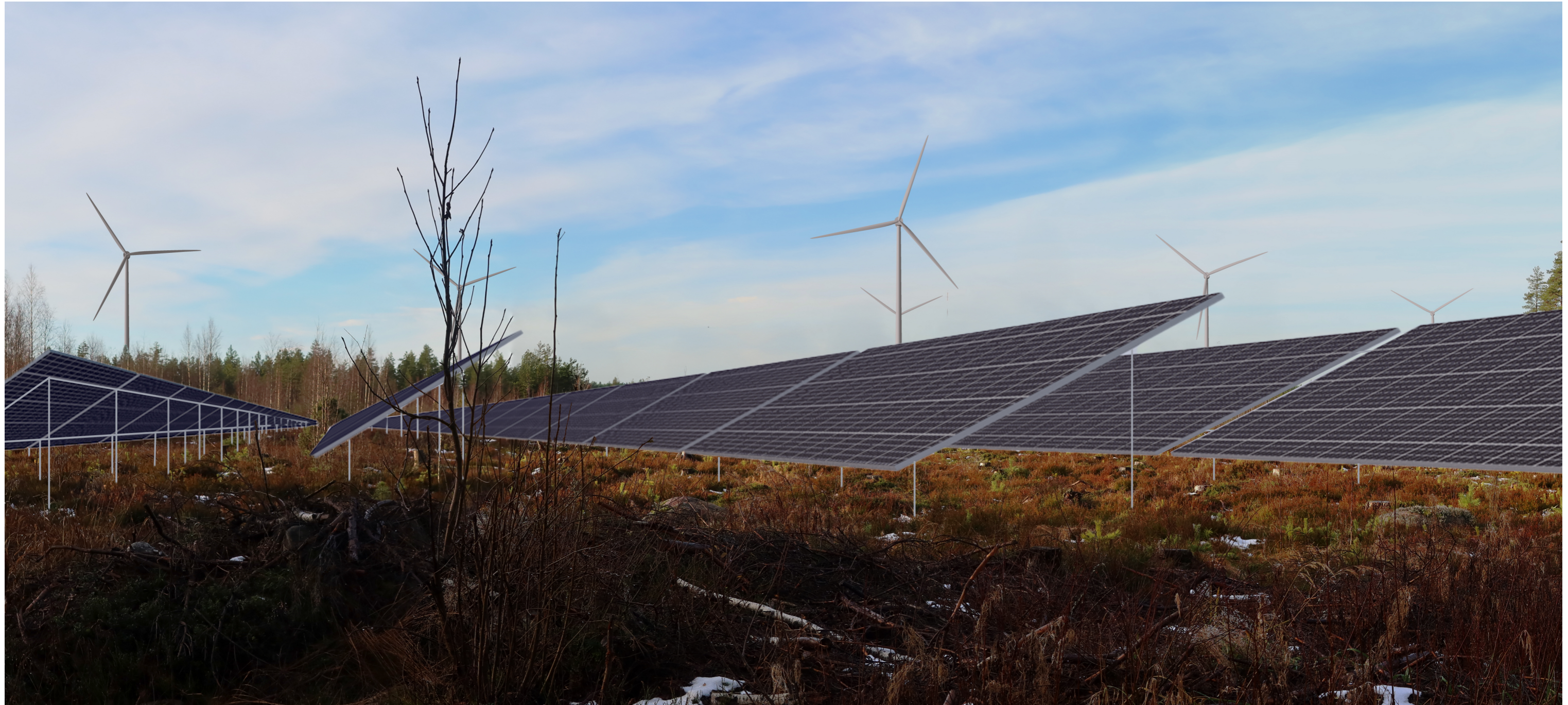
Tarkennettu kuva voimaloista