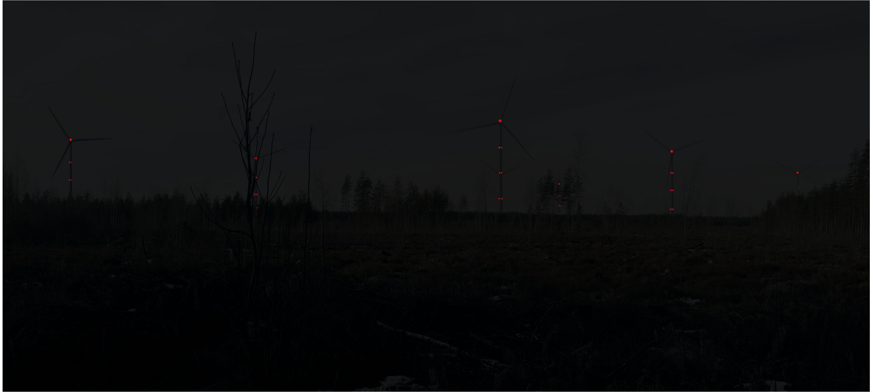
Tarkennettu pimeään ajan havainnekuva Ylikalliontieltä kuvattuna