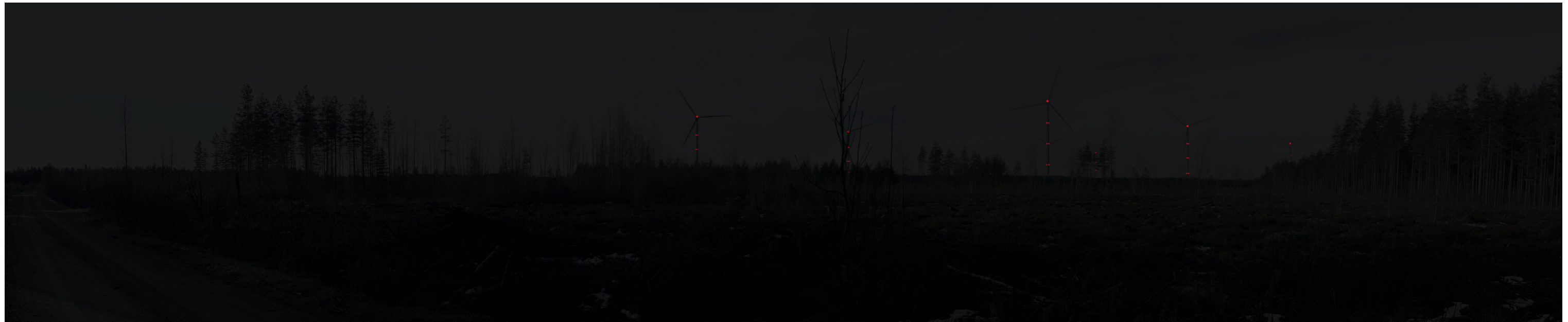
Pimeän ajan havainnekuva Ylikalliontieltä kuvattuna