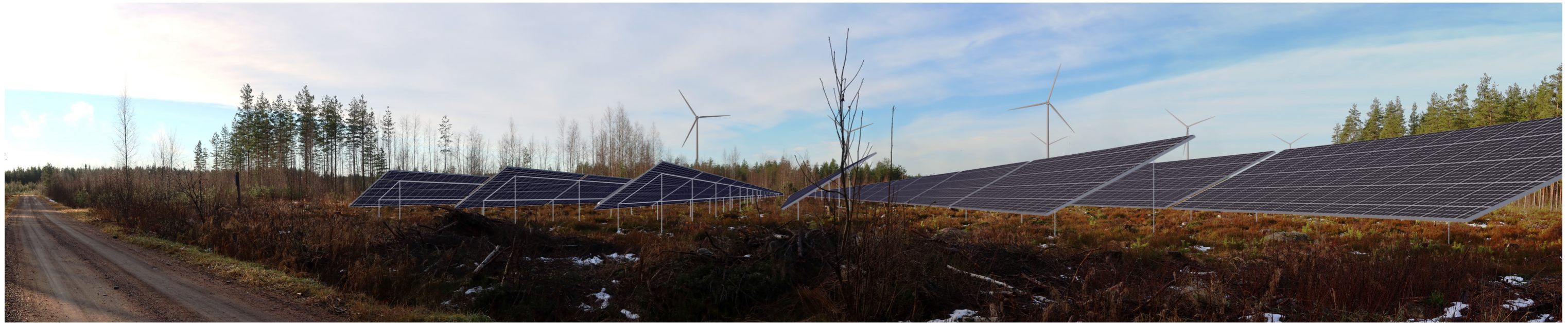
Havainnekuva, etäisyys lähimmistä tuulivoimaloista 1,5 kilometriä ja aurinkovoimaloista noin 30 metriä.