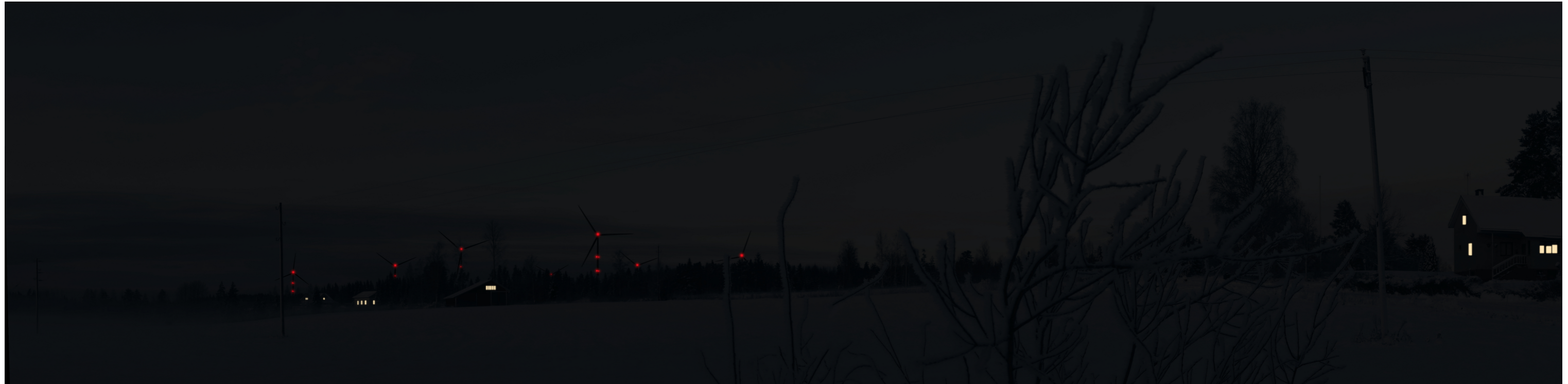
Pimeän ajan havainnekuva Krakantieltä kuvattuna