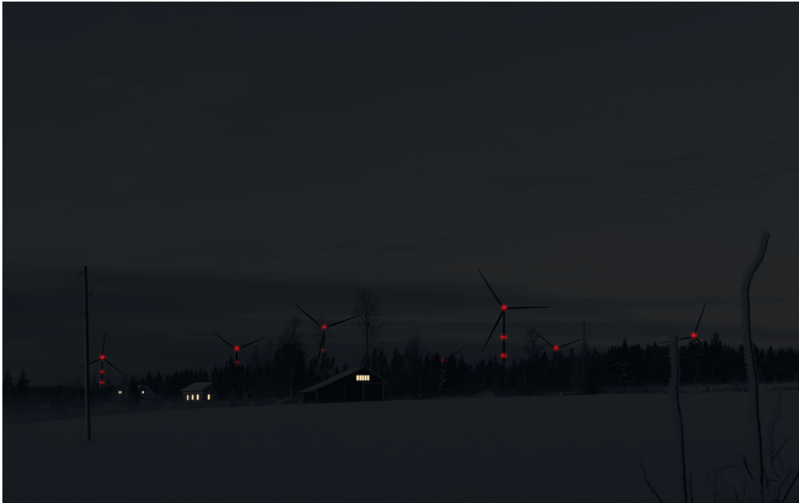
Tarkennettu hämärän ajan havainnekuva Krakantieltä kuvattuna