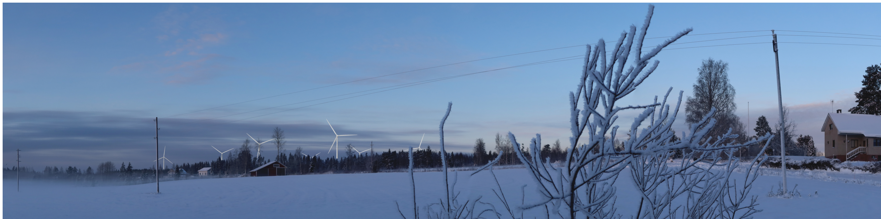
Havainnekuva voimaloista 2,6 km