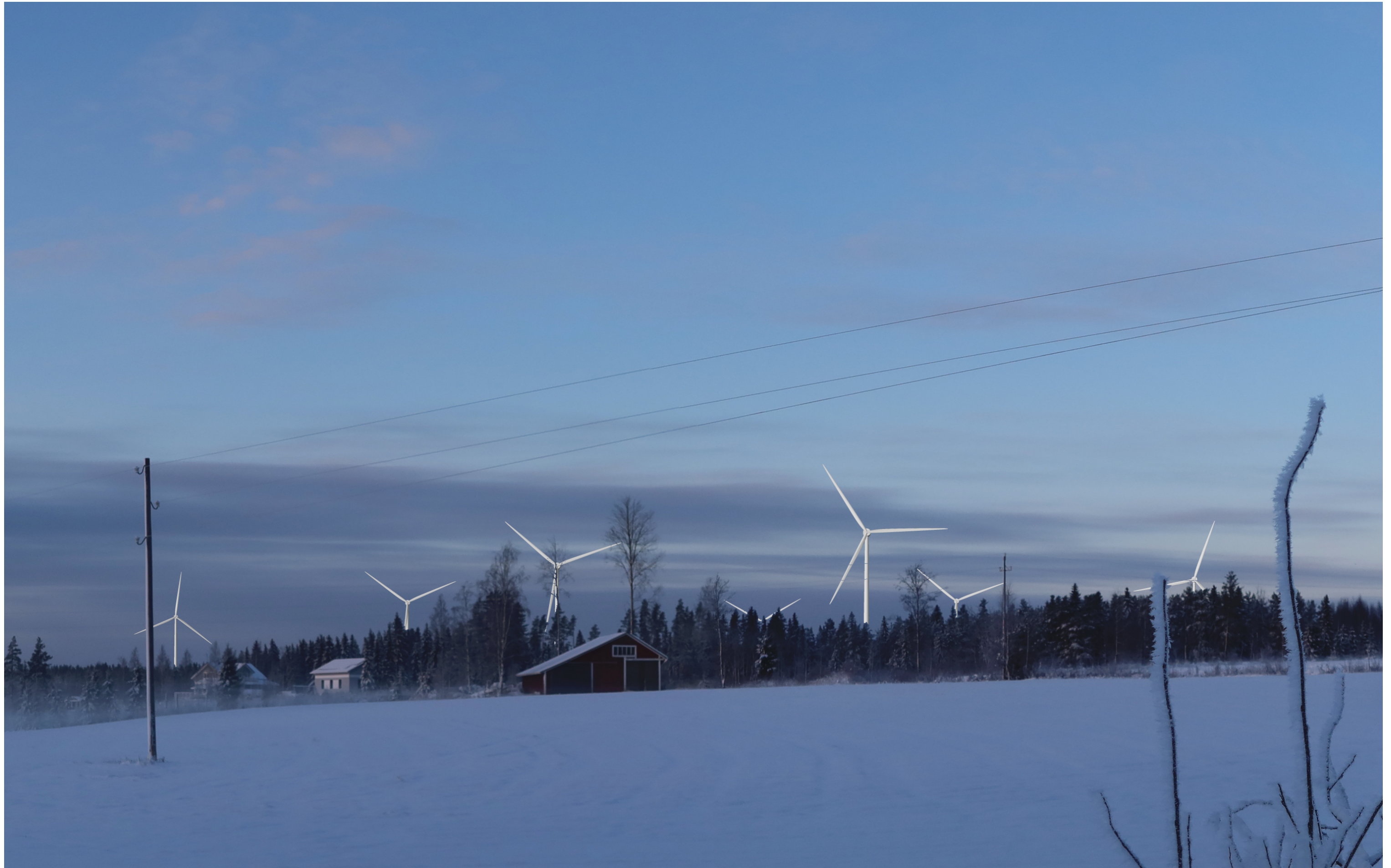
Tarkennettu havainnekuva voimaloista