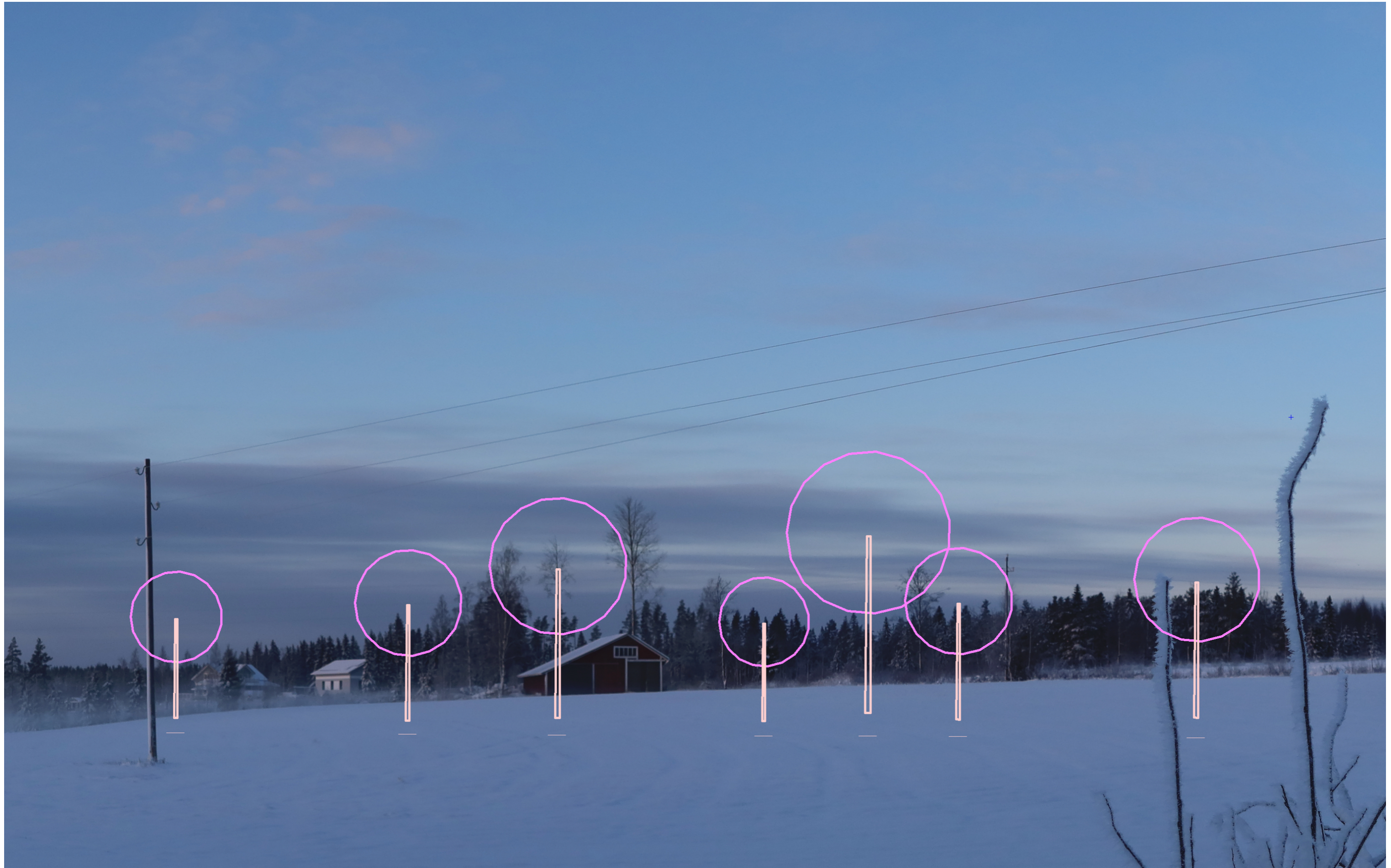
Tarkennettu symbolikuva. Kuvakulma vastaa kinofilmikoon 50 mm objektiivin kuvakulmaa.