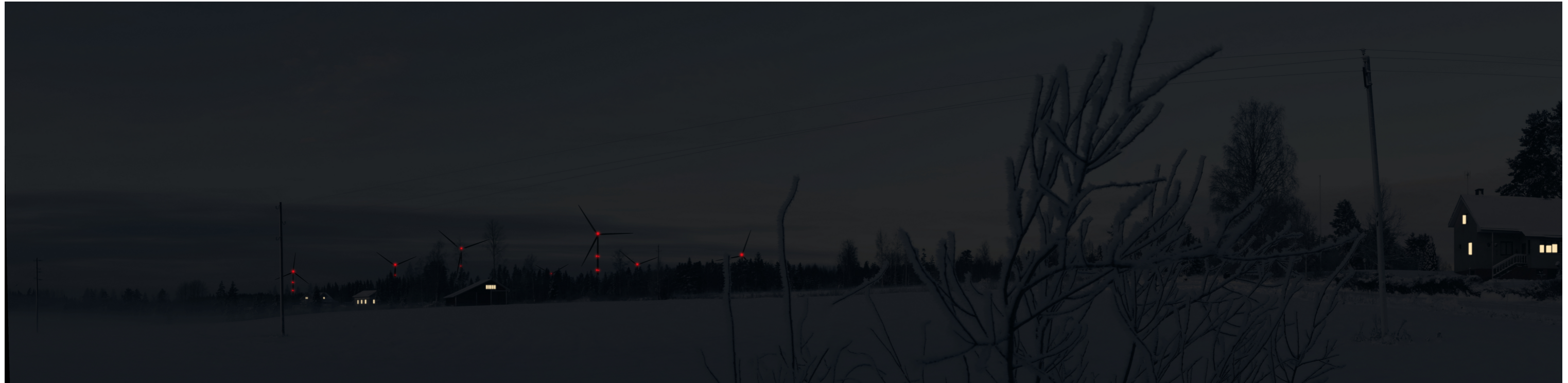
Hämärän ajan havainnekuva Krakantieltä kuvattuna