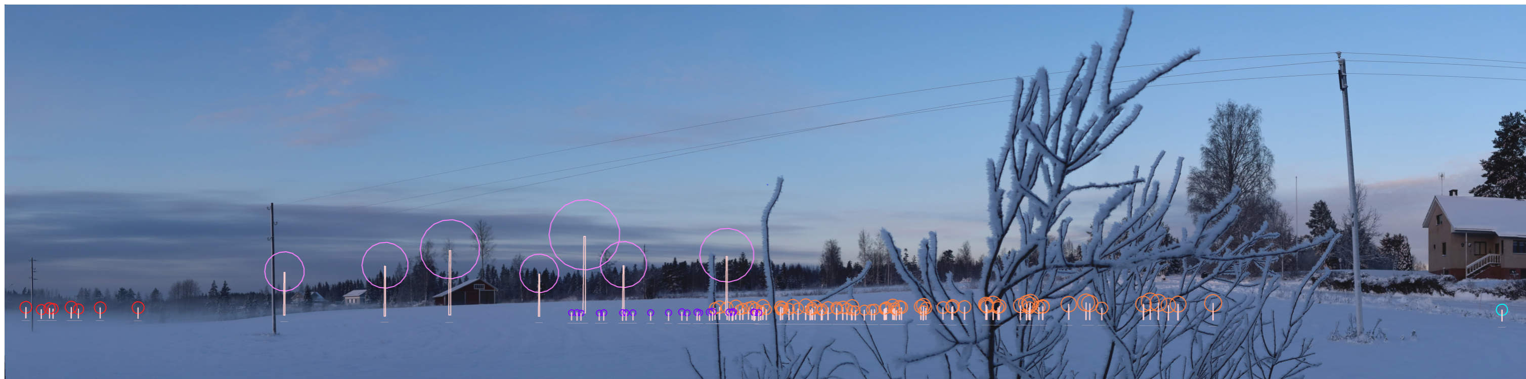
Symbolikuva yhteisvaikutusta pinkillä Santakangas, punaisella Kultakalliot, violetilla Surmankeidas, oranssilla Kolmihaara ja vaaleansinisellä Marjakeidas