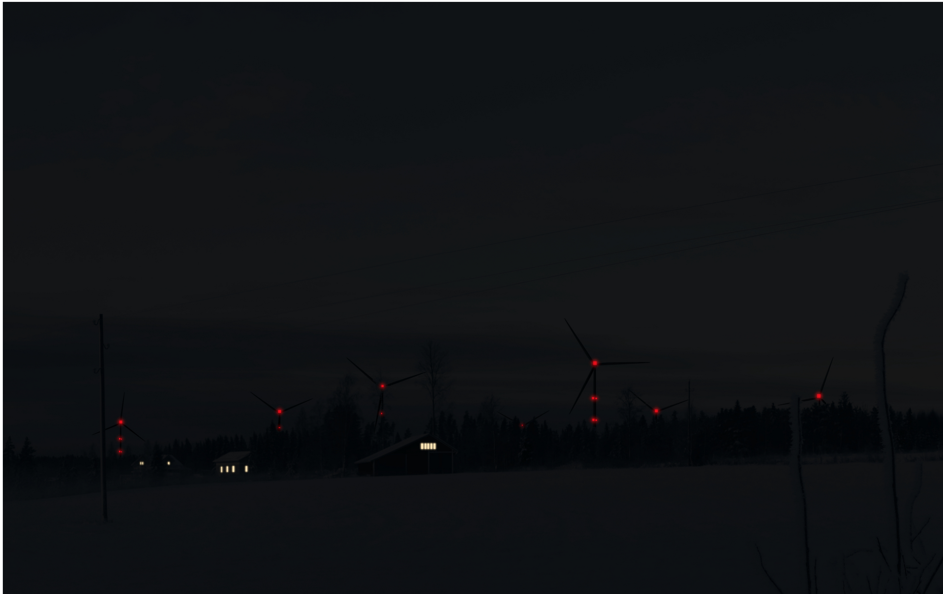
Tarkennettu pimeän ajan havainnekuva Krakantieltä kuvattuna