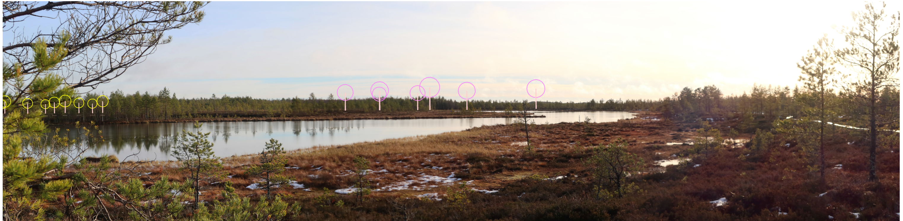
Symbolikuva yhteisvaikutuksista keltaisella Haukkasalo ja pinkillä Santakangas