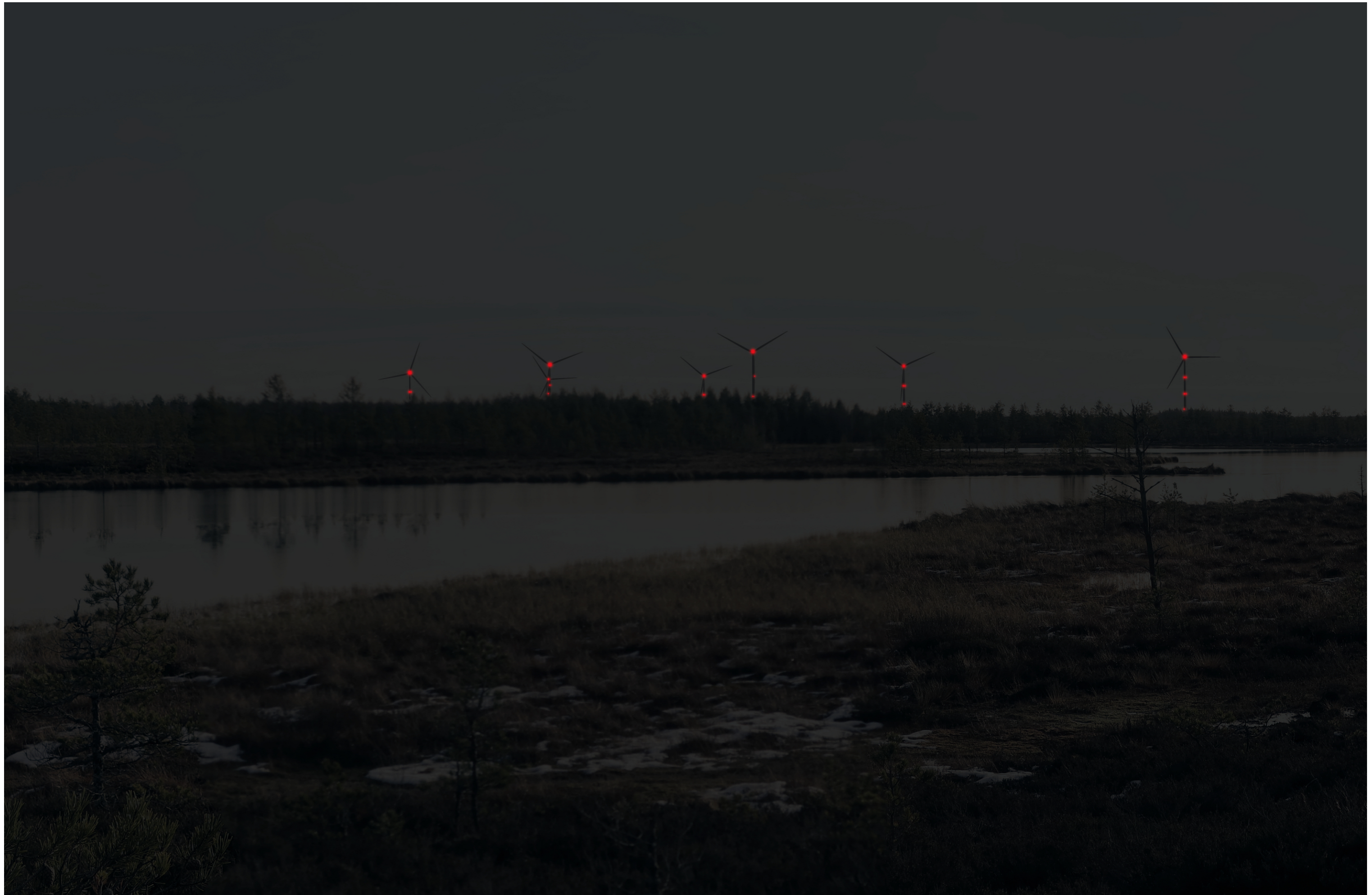
Tarkennettu hämärän ajan havainnekuva voimaloista