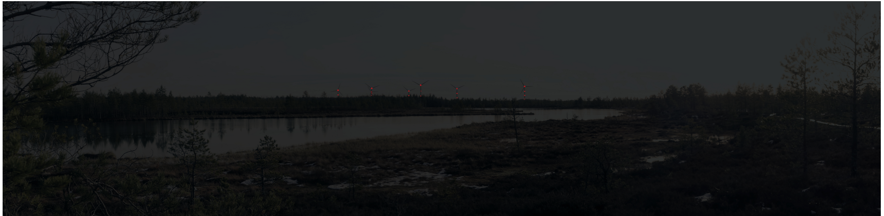
Hämärän ajan havainnekuva voimaloista