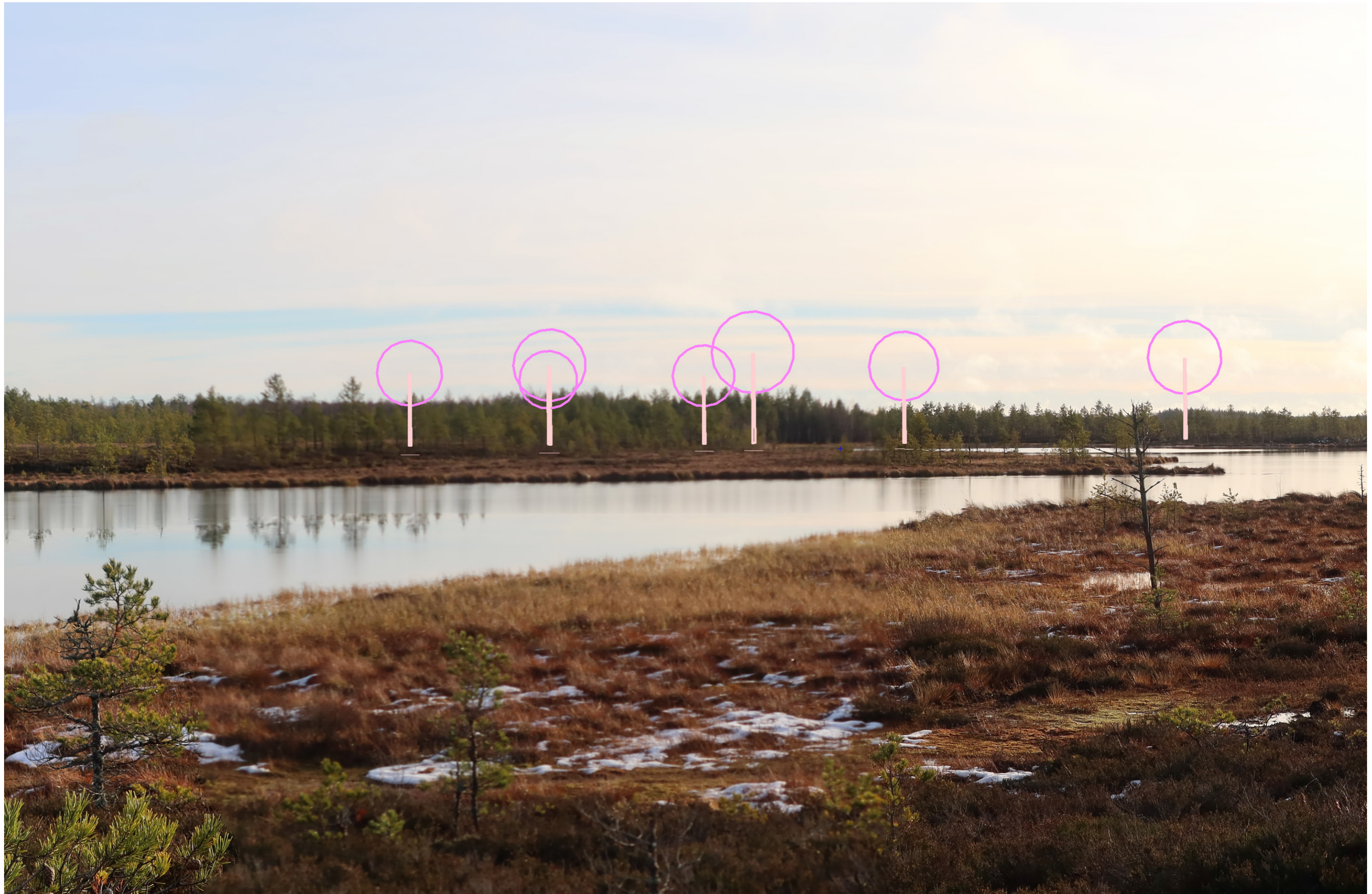
Tarkennettu symbolikuva. Kuvakulma vastaa kinofilmikoon 50 mm objektiivin kuvakulmaa.