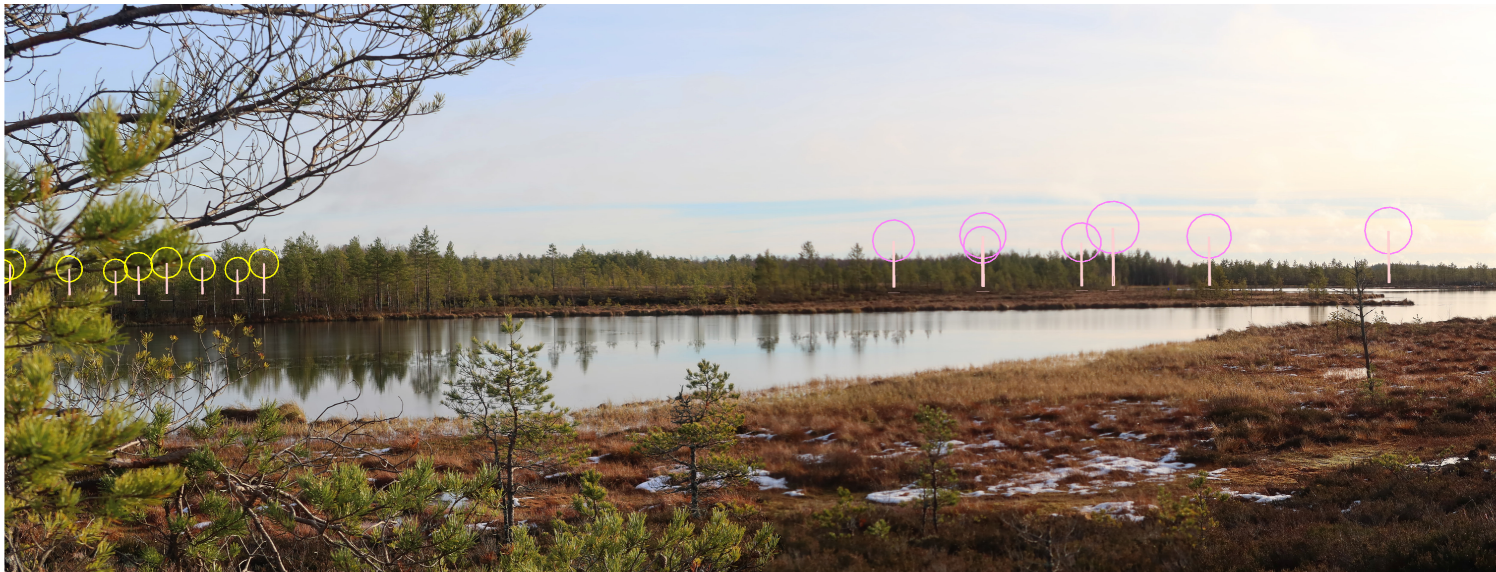
Tarkennettu symbolikuva yhteisvaikutuksista