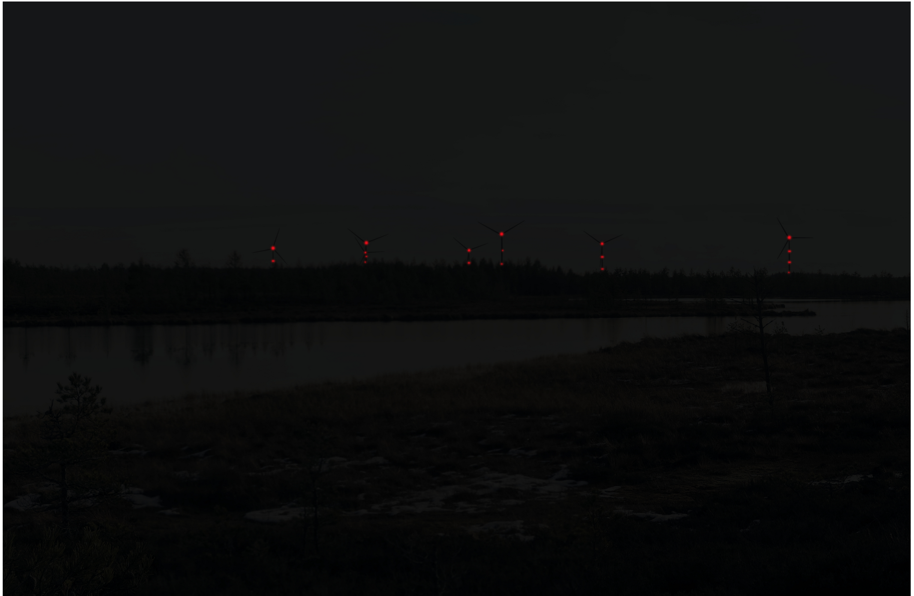
Tarkennettu pimeän ajan havainnekuva voimaloista