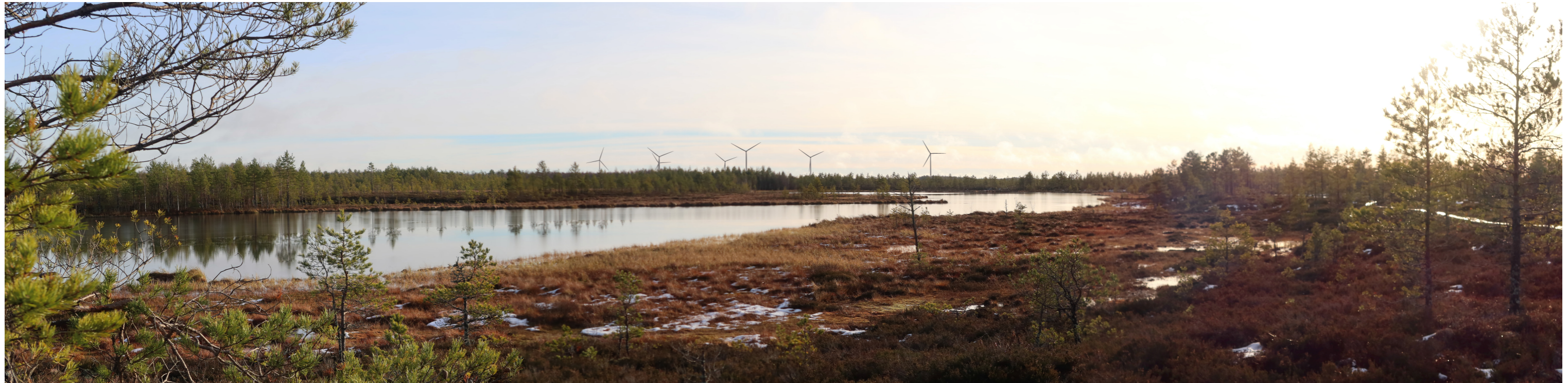
Havainnekuva voimaloista 5 km