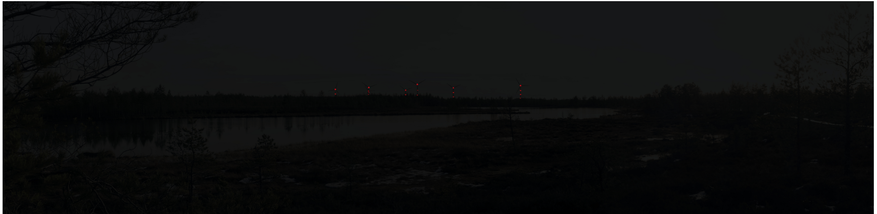
Pimeän ajan havainnekuva voimaloista