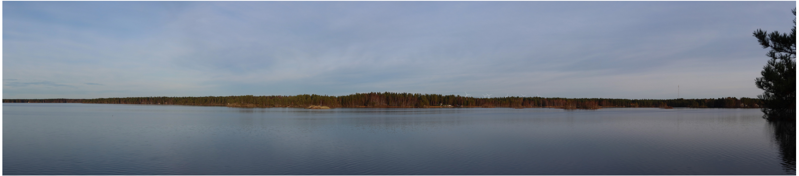
Havainnekuva voimaloista 9,3 km