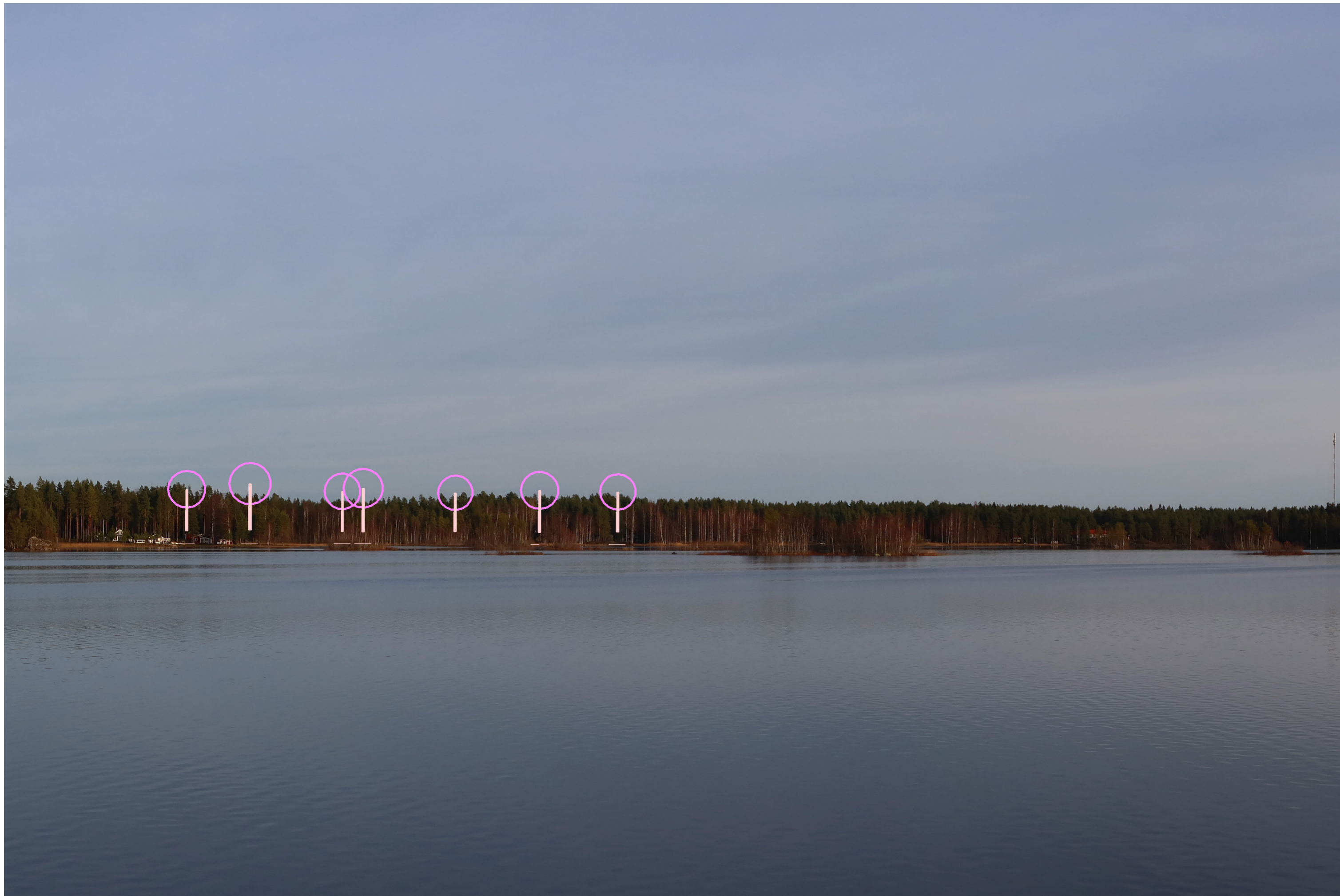
Tarkennettu symbolikuva. Kuvakulma vastaa kinofilmikoon 50 mm objektiivin kuvakulmaa.