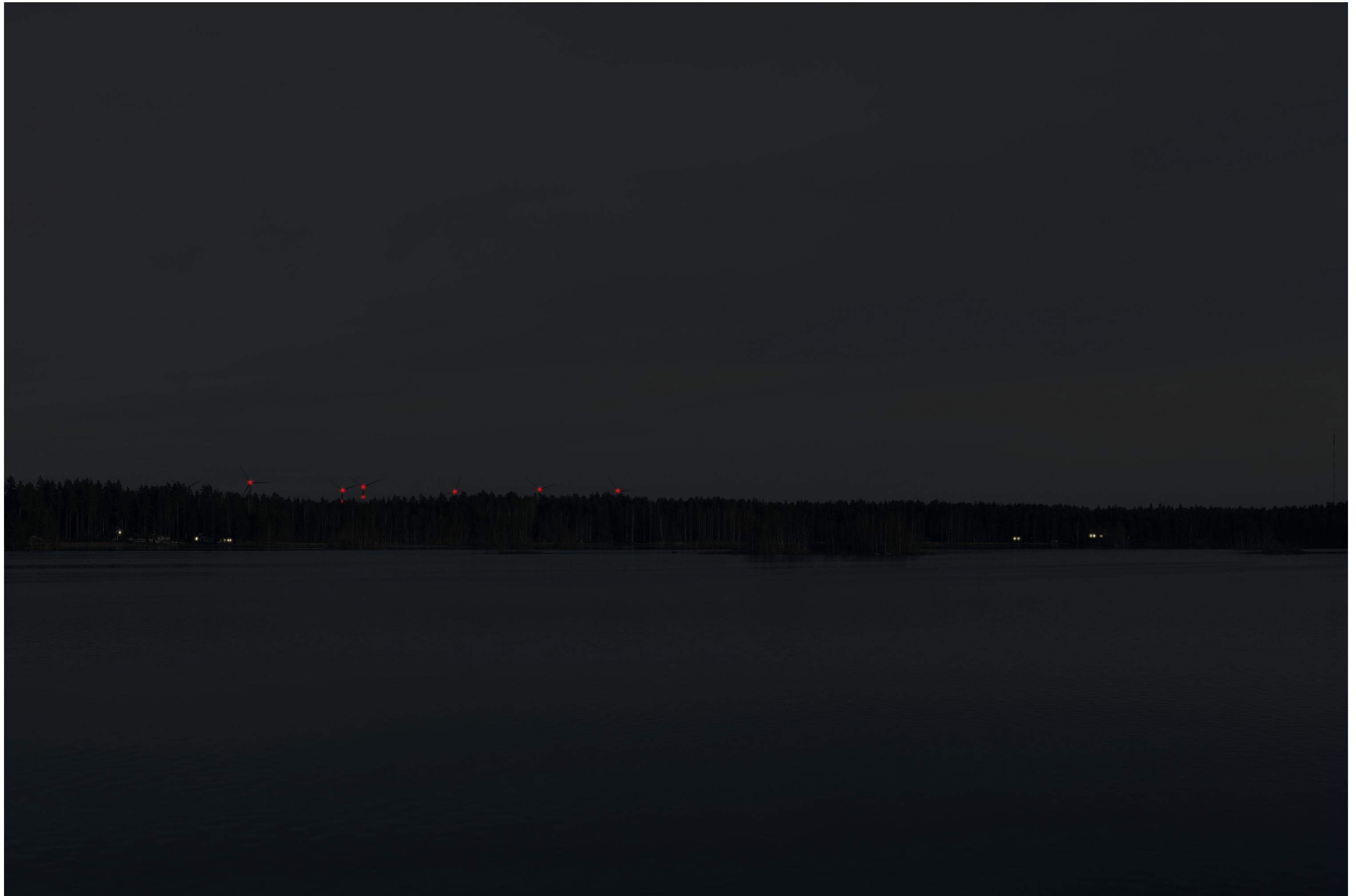
Tarkennettu hämärän ajan havainnekuva voimaloista