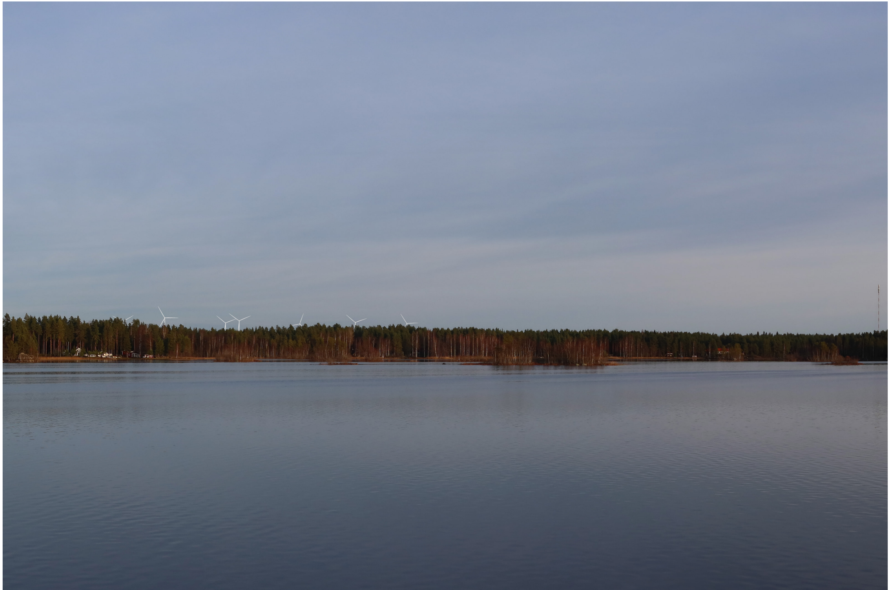
Tarkennettu havainnekuva voimaloista