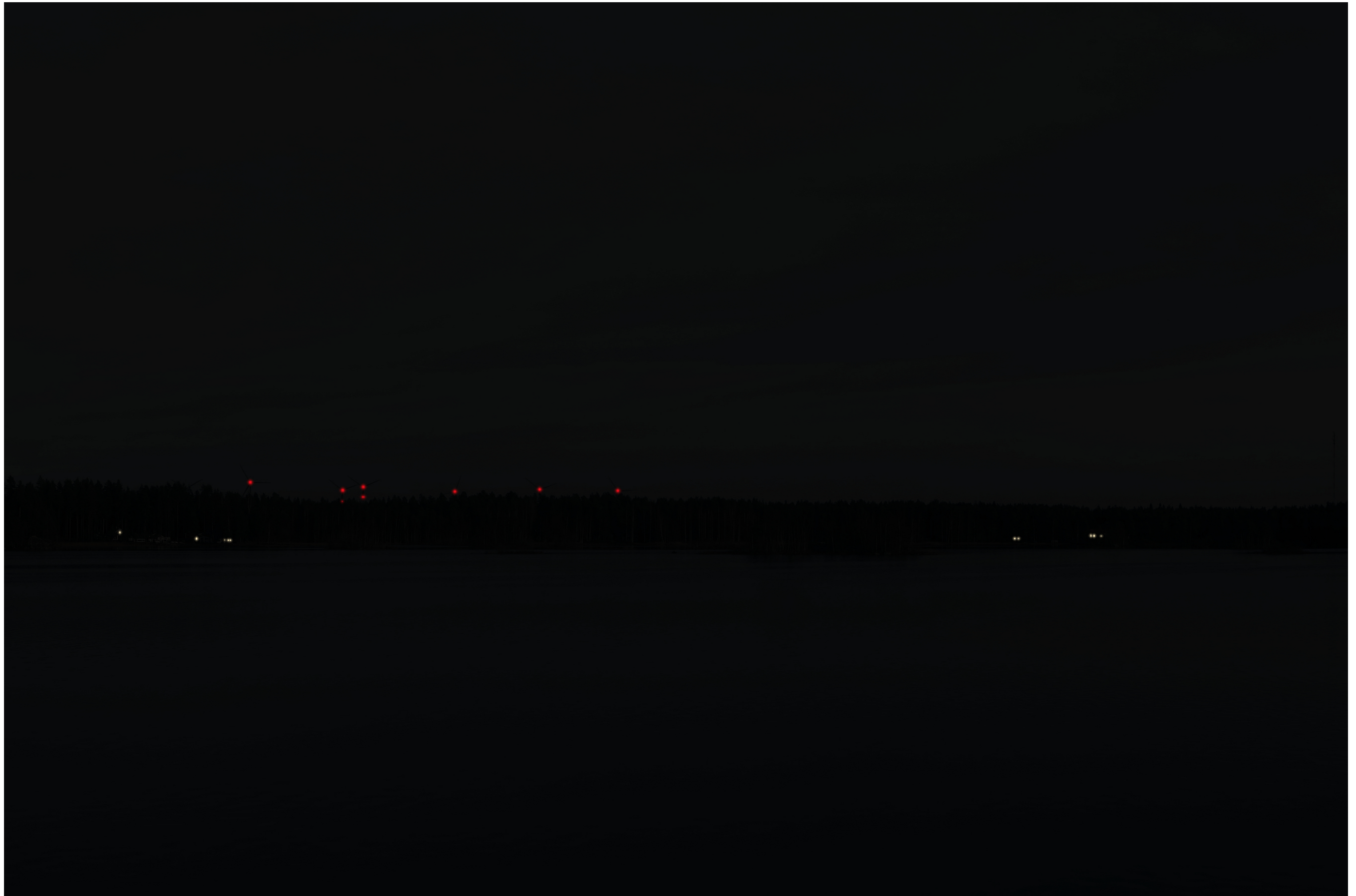
Tarkennettu pimeän ajan havainnekuva voimaloista