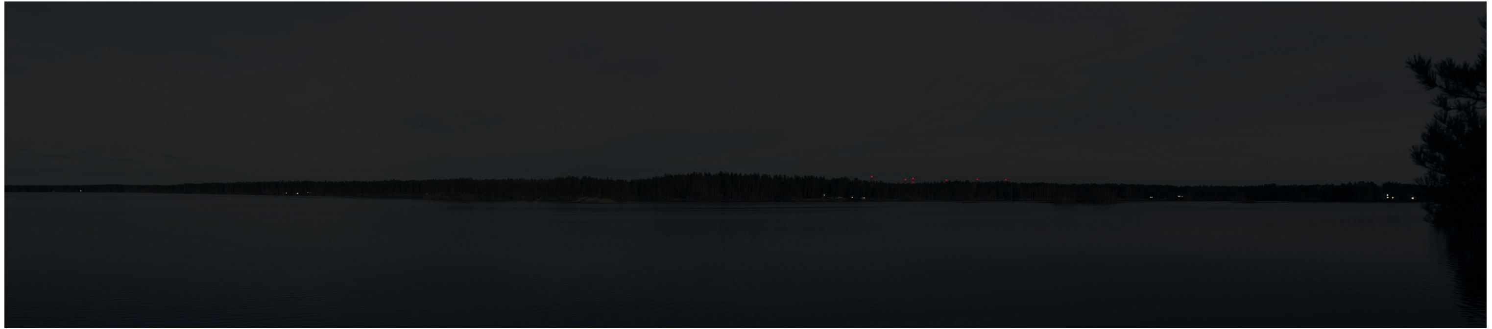
Hämärän ajan havainnekuva voimaloista