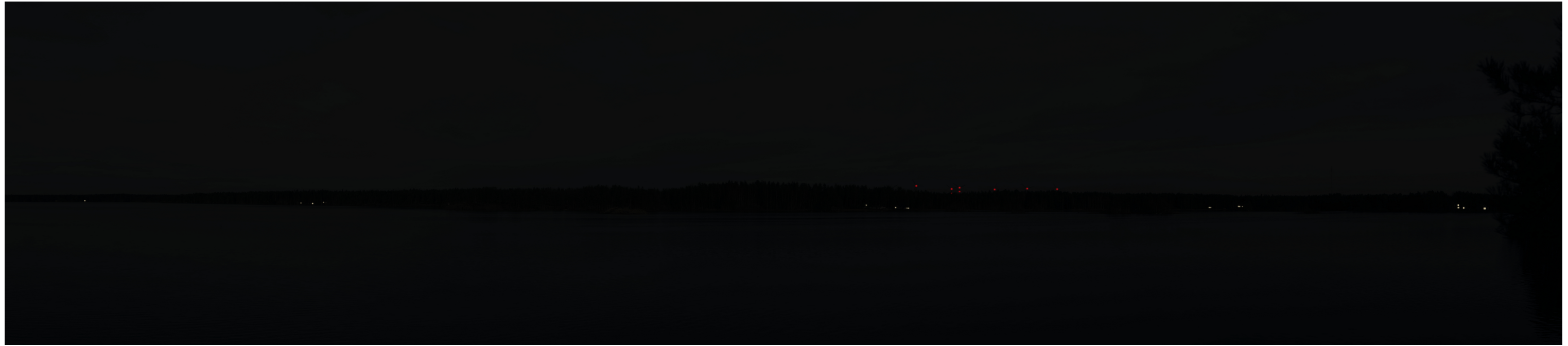
Pimeän ajan havainnekuva voimaloista