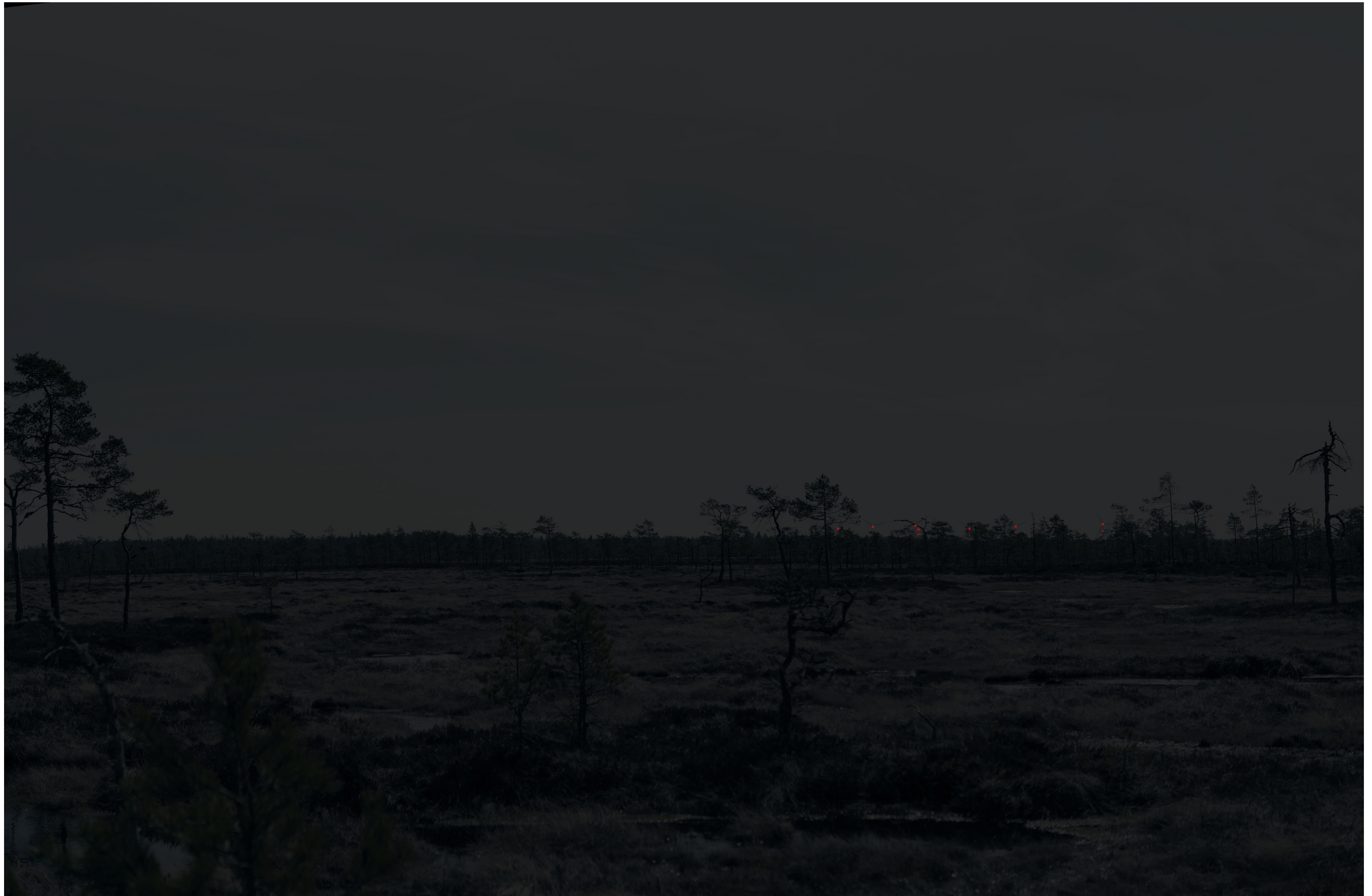
Tarkennettu hämärän ajan havainnekuva voimaloista