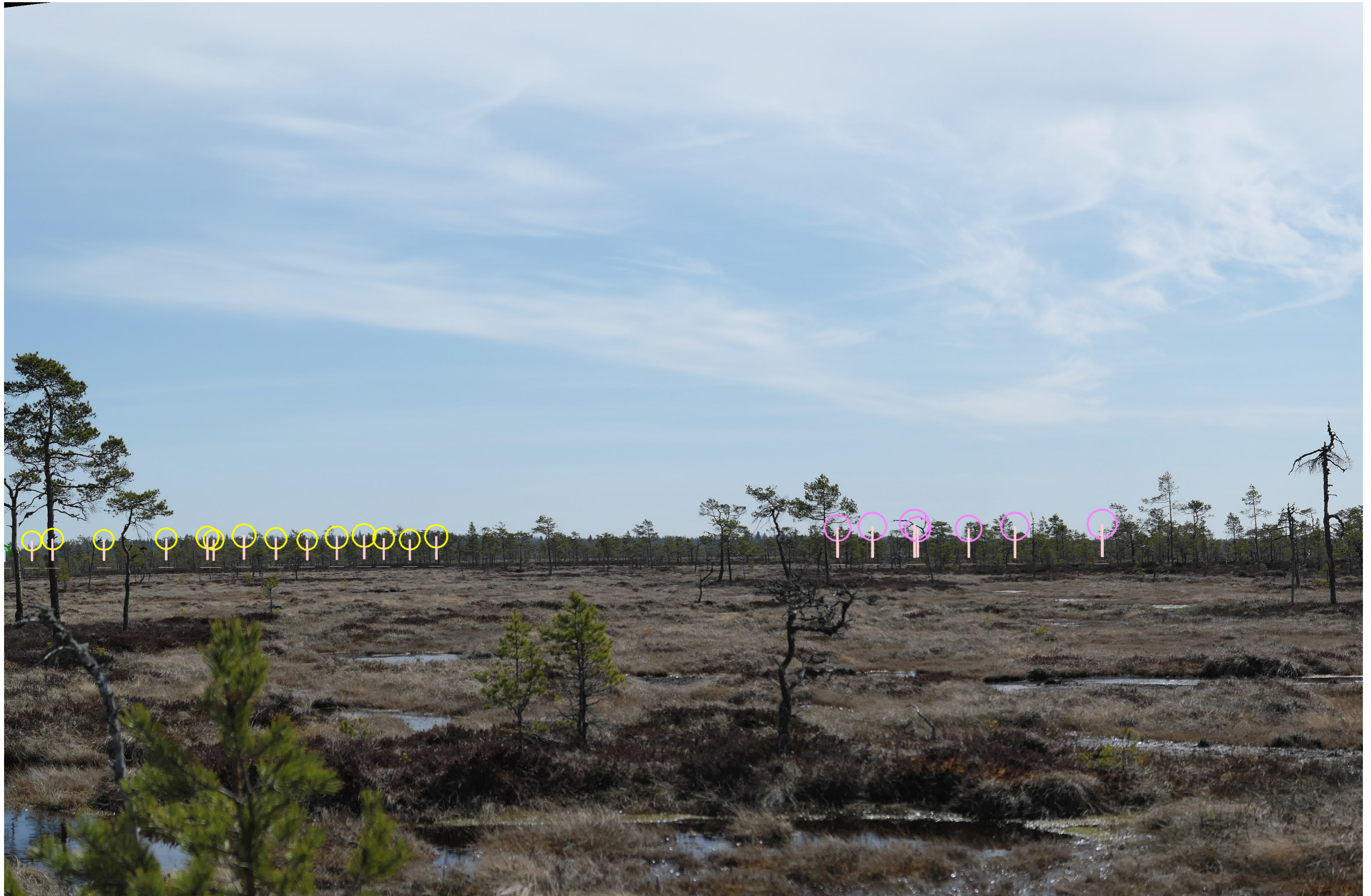
Tarkennettu symbolikuva yhteisvaikutuksista