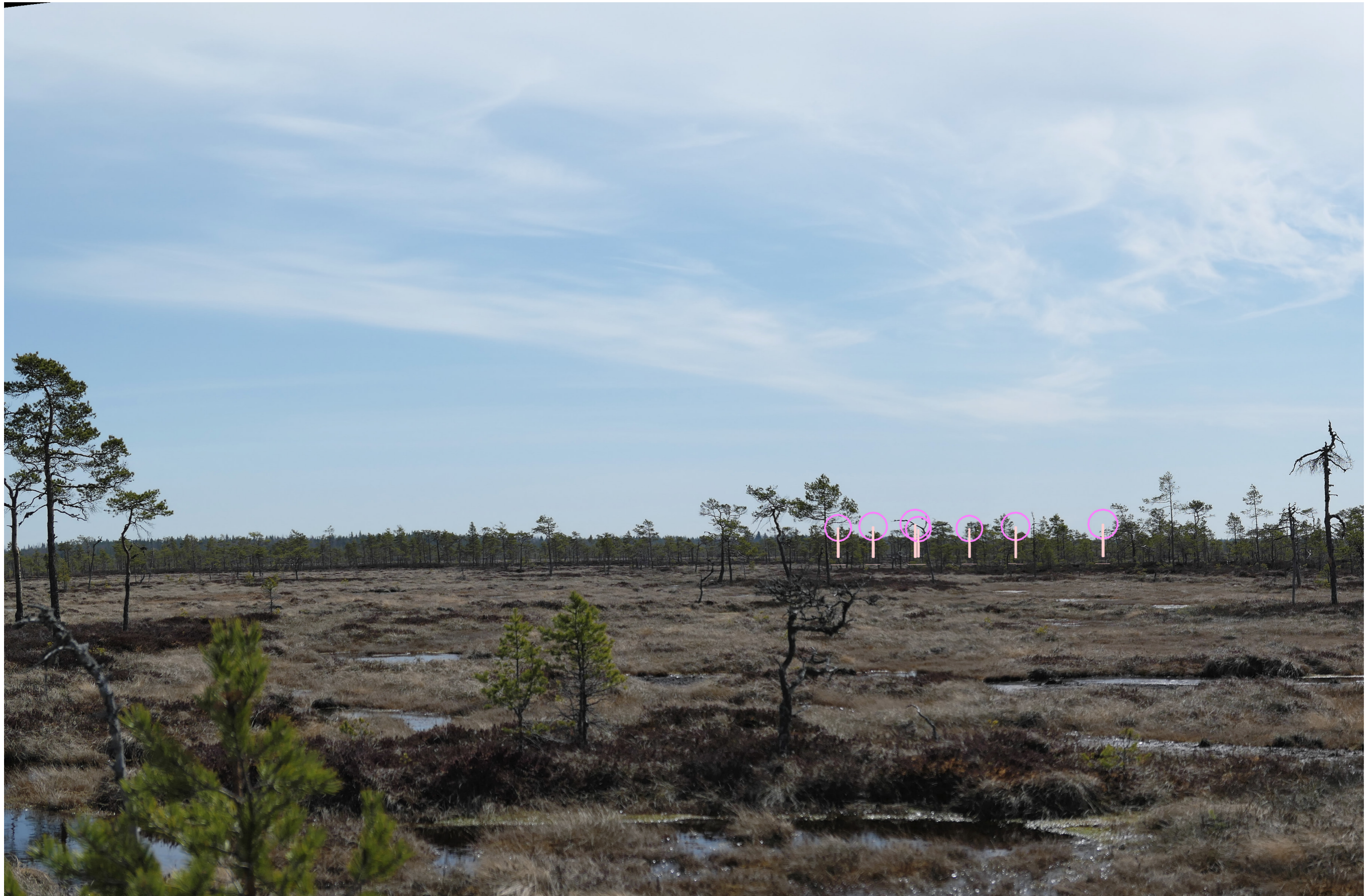
Tarkennettu symbolikuva. Kuvakulma vastaa kinofilmikoon 50 mm objektiivin kuvakulmaa.