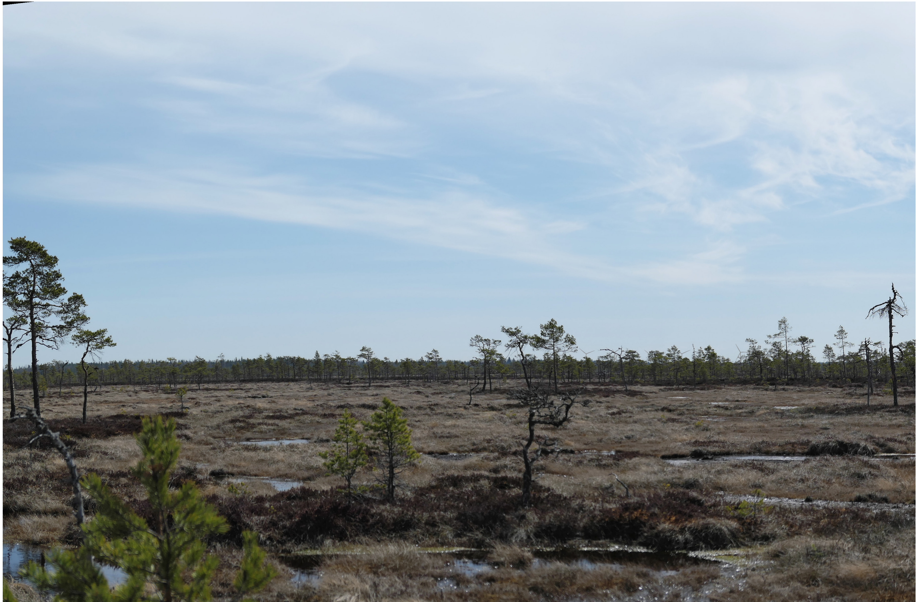
Tarkennettu havainnekuva voimaloista