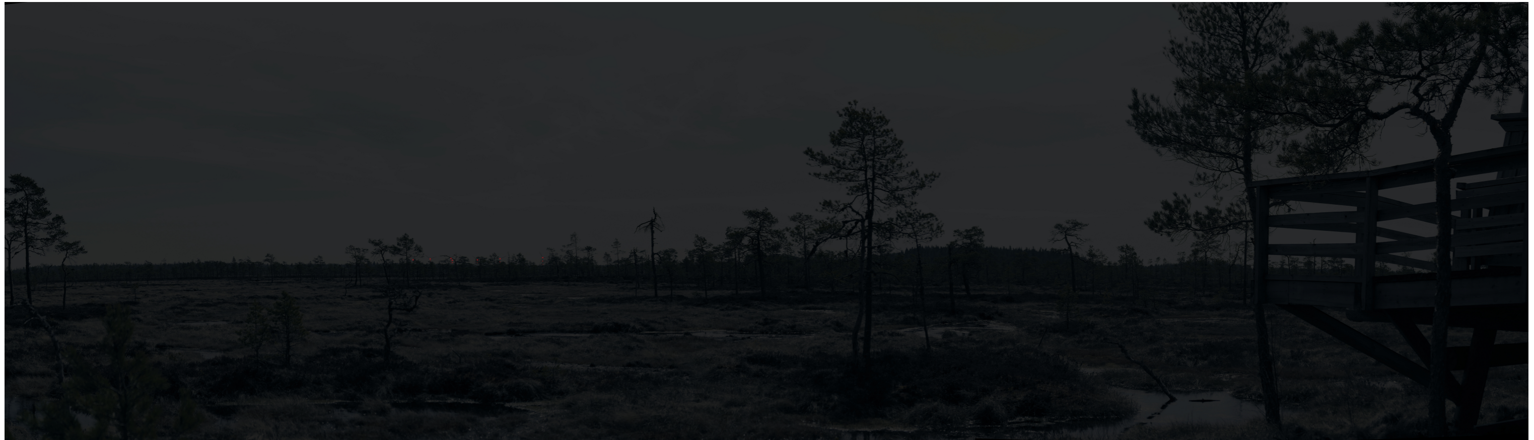
Hämärän ajan havainnekuva voimaloista