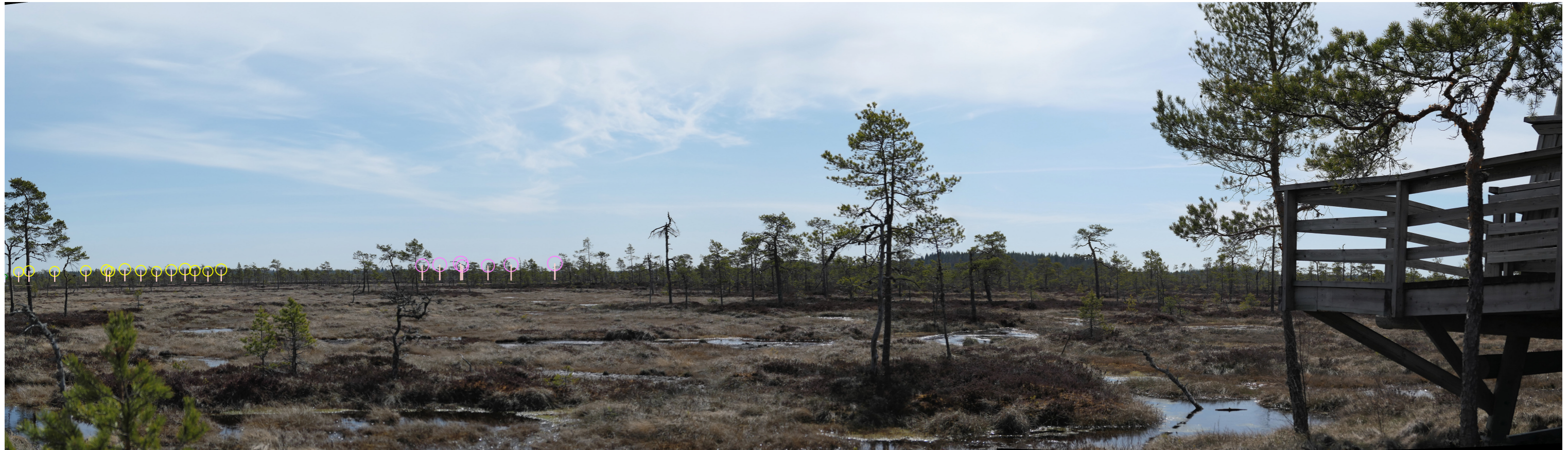
Symbolikuva yhteisvaikutuksista keltaisella Haukkasalo ja pinkillä Santakangas