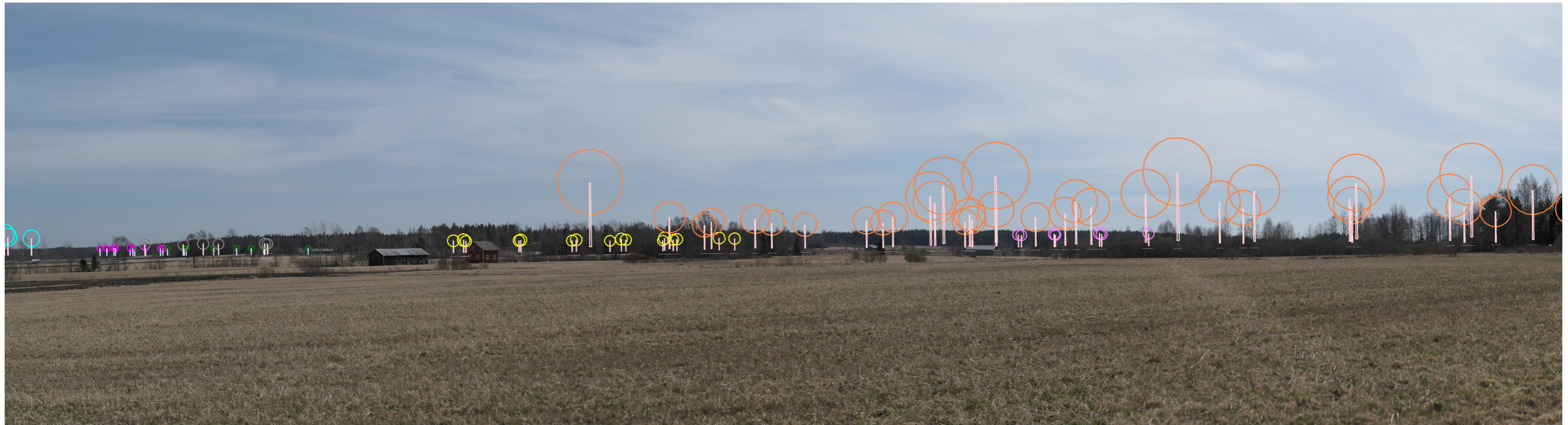
Symbolikuva yhteisvaikutuksista vaaleansinisellä Marjakeidas, fuksialla Kirkkokallio, vihreällä Kooninkallio, harmaalla Paholammi, keltaisella Haukkasalo, oranssilla Kolmihaara ja pinkillä Santakangas