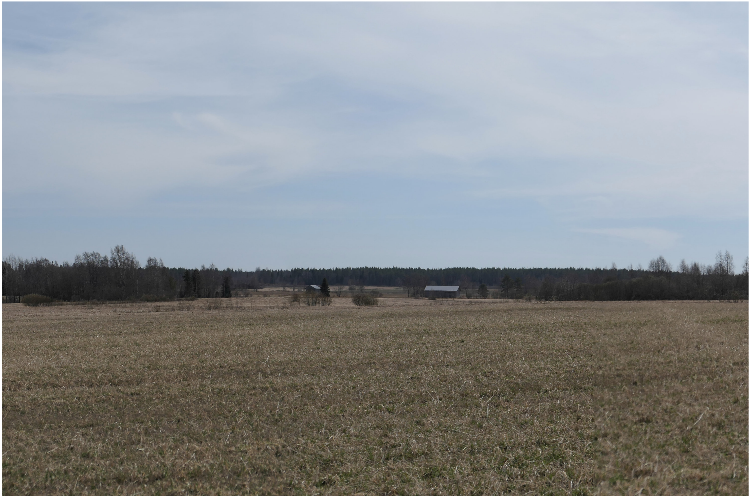
Tarkennettu havainnekuva voimaloista