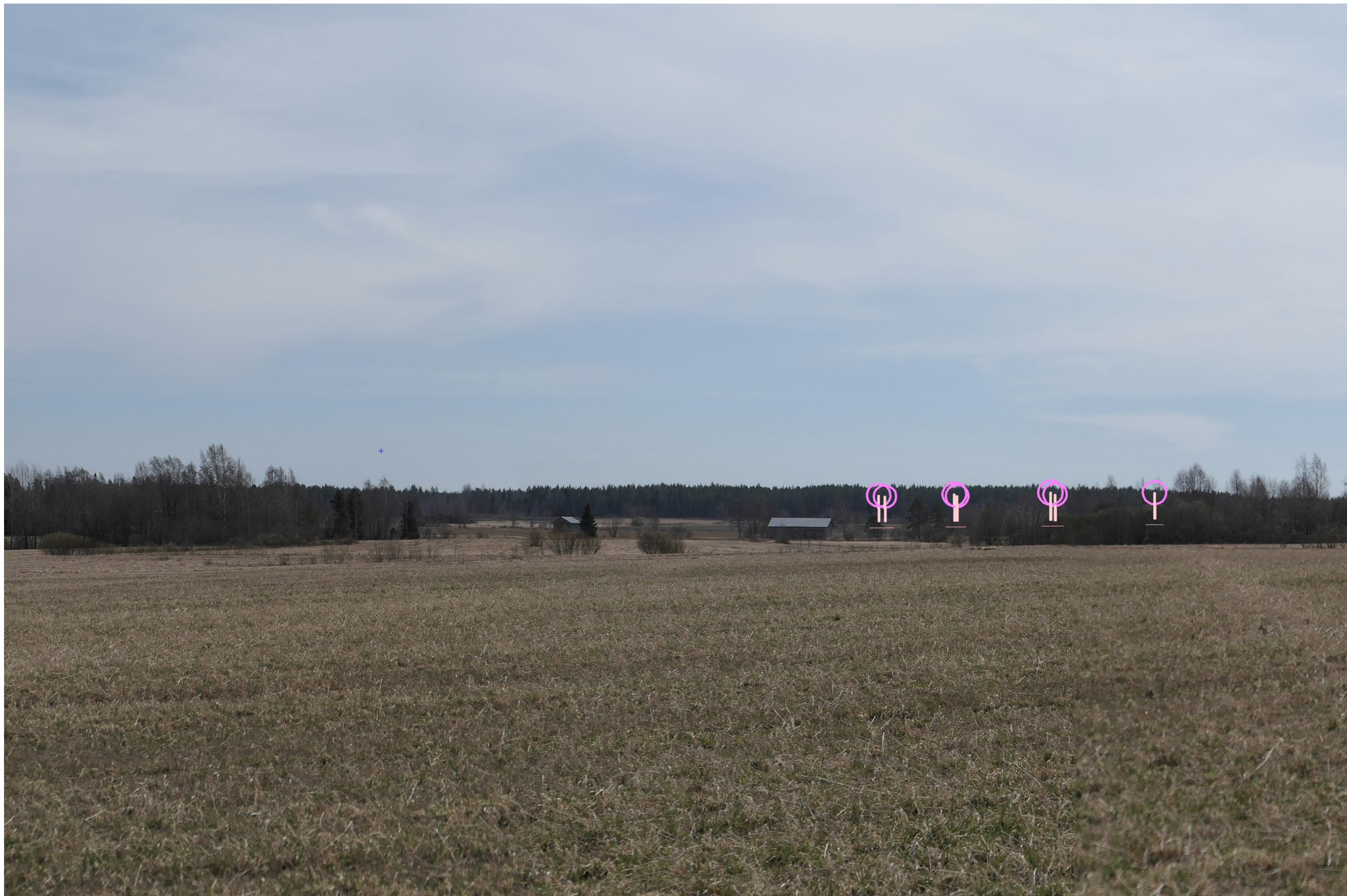
Tarkennettu symbolikuva. Kuvakulma vastaa kinofilmikoon 50 mm objektiivin kuvakulmaa.