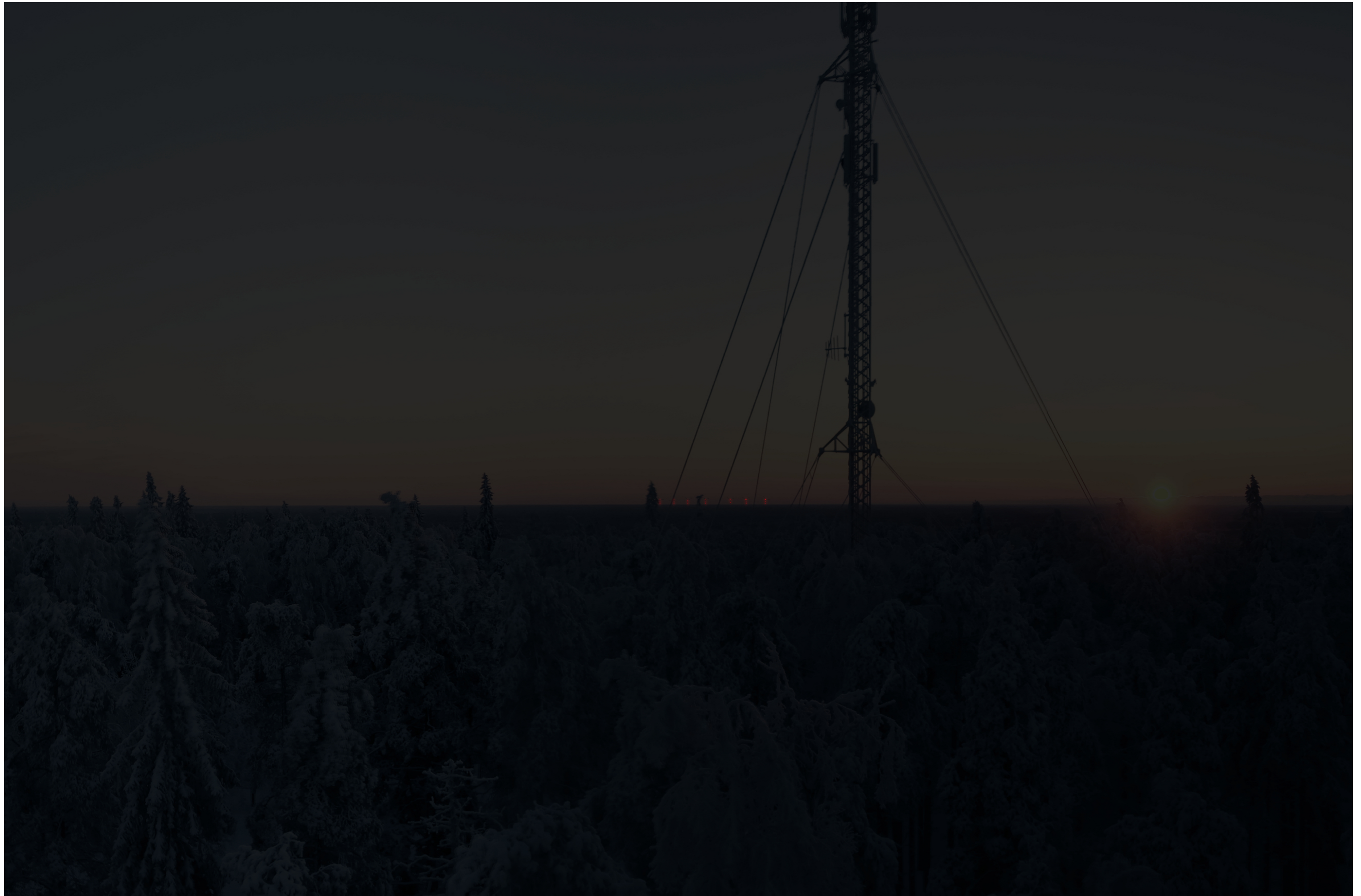
Tarkennettu pimeän ajan havainnekuva voimaloista