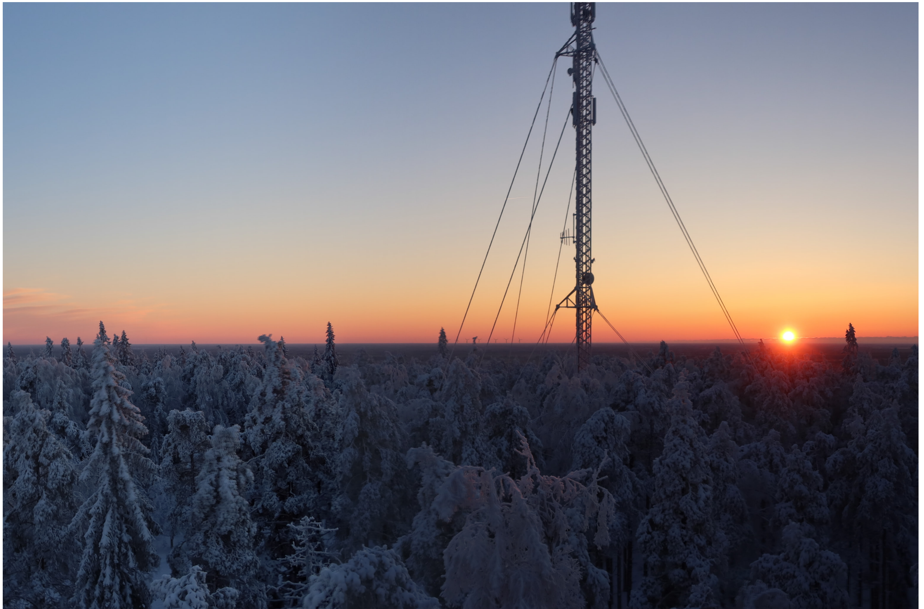
Tarkennettu havainnekuva voimaloista