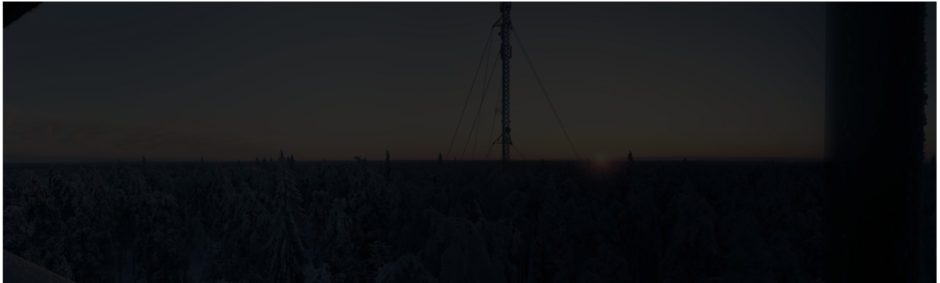
Pimeän ajan havainnekuva voimaloista