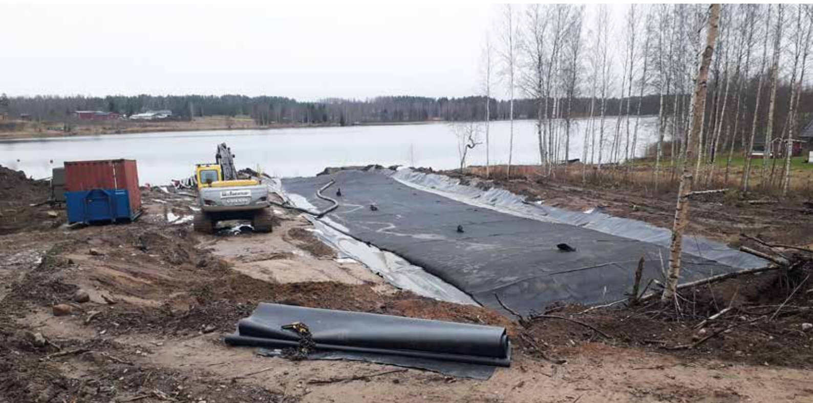
Geotuubikentän valmistelu.